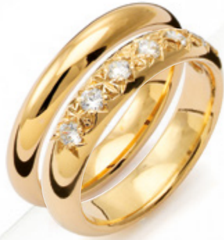
B052 i kombination med 2235 från Traditionserien