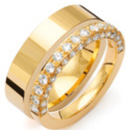
B064 i kombination med 2552 från Traditionserien