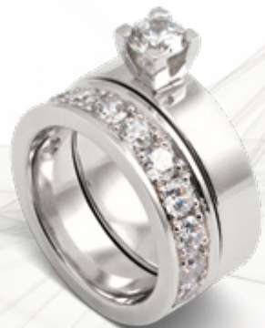
Flora / B212 - 0,60ct Veritas / B112 - 1,65ct