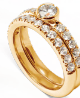
Hera / B208 - 0,75ct Ceres / B108 - 0,52ct

Dessa ringarna går att få i rött, rosa och vitt guld samt platina 950.