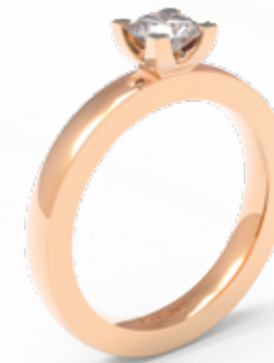
Mauro / B201 - 0,50ct