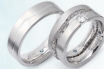
VGAZ2 VGAZB2 VGAZBS2

Alla ringarna i denna serie går att ändra efter dina önskemål. Välj själv färg, höjd och bredd. Det går även bra att beställa dem i palladium och platina.