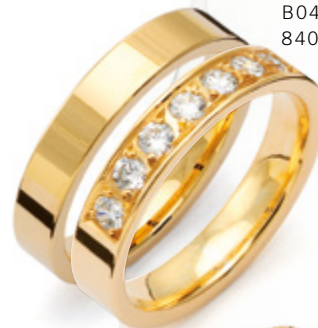
B048 i kombination med 8409N/4 från Traditionserien