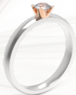
Brize / B213 - 0,25ct