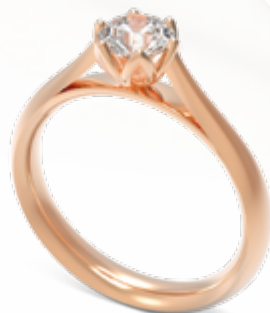
Cypria / B205 - 0,50ct