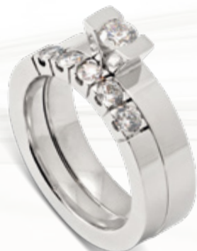
Victoria / B210 - 0,25ct Maia / B110 - 0,50ct