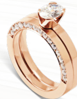
Luna / B209 - 0,80ct Artemis / B109 - 0,32ct