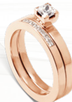
Venus / B211 - 0,40ct Minerva / B111 - 0,16ct