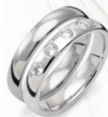
B025 i kombination med VG114/3,5 från Traditionserien