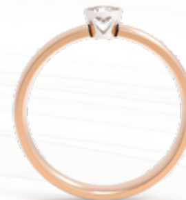
Kardiá / B204 - 0,15ct