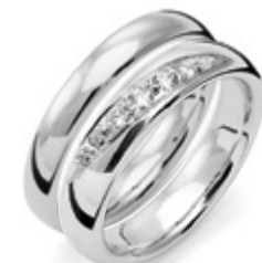
B045 i kombination med VGK628/3,5 från Traditionserien