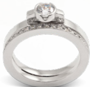
Athena / B206 - 0,40ct Aurora / B106 - 0,30ct