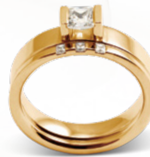
Fortuna / B207 - 0,40ct Afrodite / B107 - 0,06ct