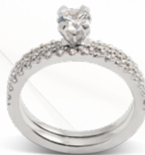
Juno / B203 - 0,74ct Diana / B103 - 0,27ct