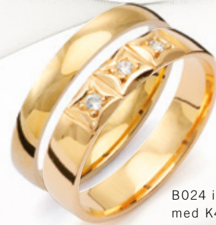
B024 i kombination med K4R3 från Traditionserien