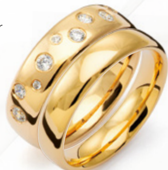
B034 i kombination med 803/4,5 från Traditionserien